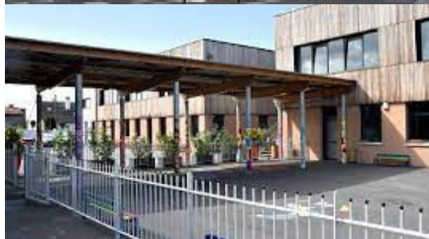
École Notre-Dame à Argenteuil

“ Nous avons sollicité la Fondation Saint Matthieu pour nous accompagner dans nos projets d'investissements et de rénovation. En effet, nous souhaitons mettre en place un projet de caisse de solidarité et de recueil de dons pour nous aider à financer nos projets d'investissement et nos gros travaux d'entretien des locaux.