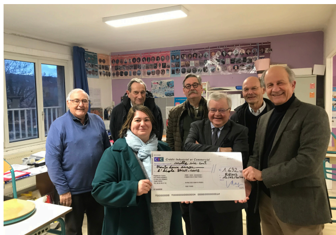
Remise de chèque de 1 632 € à l'école Saint-Louis de Reims

En 2024 et 2025, nous allons financer l'audit énergétique de dix petites écoles des diocèses de Reims-Ardenne et de Châlons.