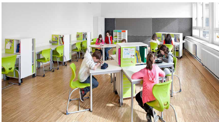
Photo projection de la future salle de classe

Modernisation de salles de classes. Ecole Sainte-Marie de Braine (02)